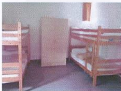
Vue d'une chambre