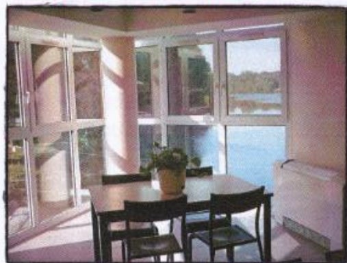
Vue de la salle à manger