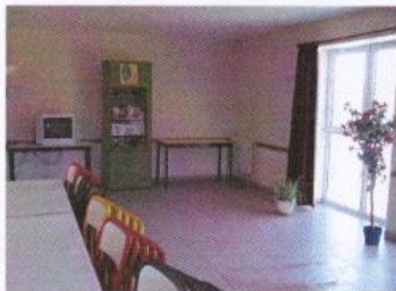
Vue de la salle de réunion